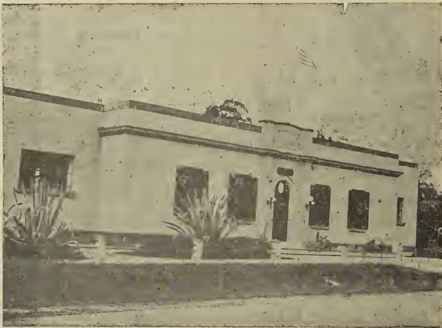
Liceo "Daniel Armand Ugon"